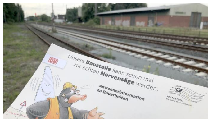
Die Bahn hat das Projekt Wunderline vorgestellt.

Ihren - „Schnell, komfortabel, zuverlässig“: Mit diesen Worten wirbt die Deutsche Bahn für die Wunderline. Doch bis über die neugeplante Strecke ein Zug von Groningen in den Niederlanden nach Bremen fahren wird, vergeht noch viel Zeit. Sowohl der Ausbau der Strecke im Oberledingerland sowie im Rheiderland als auch der Neubau der Friesenbrücke über die Ems sollen mit dem Beginn des Winterfahrplans im Jahr 2024 abgeschlossen sein. Im Landgasthaus Gossling in Ihren haben Vertreter der Bahn am Mittwoch Auskünfte über den derzeitigen Planungstand geben.